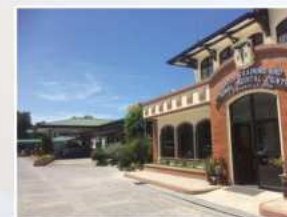
Ilcos Training & Regional Medical Center, The Medical City in Manila