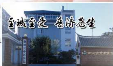
云南施甸县中医医院