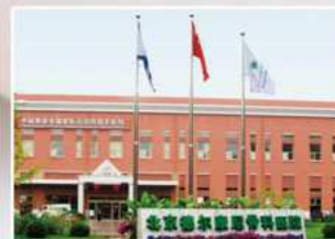
北京德尔康尼骨科医院 (中国奥委会国家队运动员指定医院)