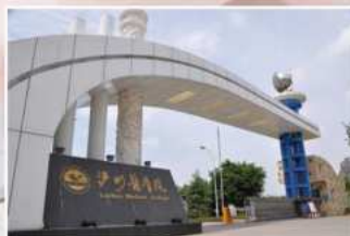
西南医科大学中医医院影像中心